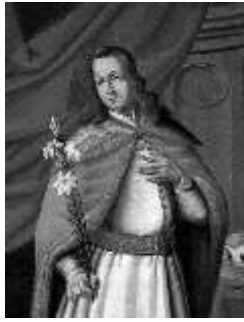
Szent Imre herceg .