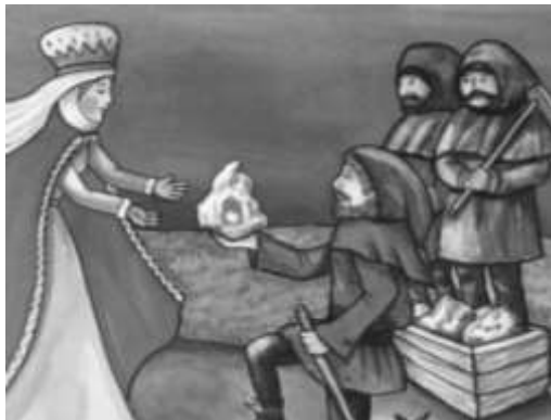
Szent Kinga/Kuniguda .