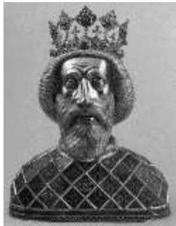
I. Szent László