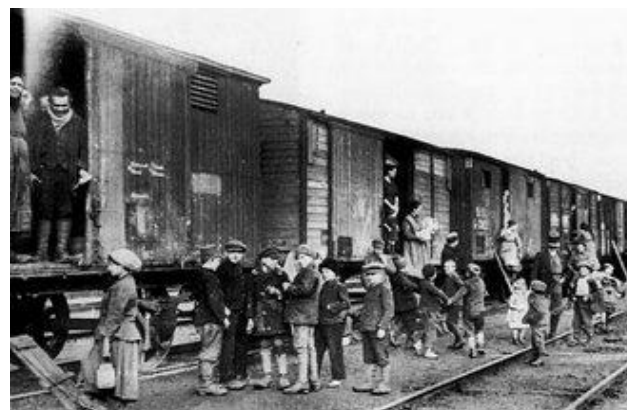
2. Vagonlakók, korabeli fotó

3. „Évégre az állam mindennemű iskolában gondoskodik mindkét nembeli tanulóifjúság rendszeres testneveléséről, a főiskolák körében pedig ezt minden hallgató számára lehetővé teszi, szervezi az iskolát elhagyó ifjúság testnevelését oly módon, hogy ebben 21-ik életévének betöltéséig a nemzetnek minden férfitagja kötelezően részt vegyen, támogatja azokat a társadalmi alakulatokat, melyek testneveléssel komolyan foglalkoznak s működésük nemzeti irányával a támogatást megérdemlik.”