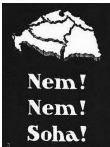
1. Revíziós plakát

5. Rendeld a forrásokhoz a leginkább hozzájuk illő állítást! (Elemenként 1 pont.)