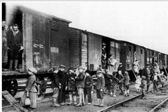
2. Vagonlakók, korabeli fotó