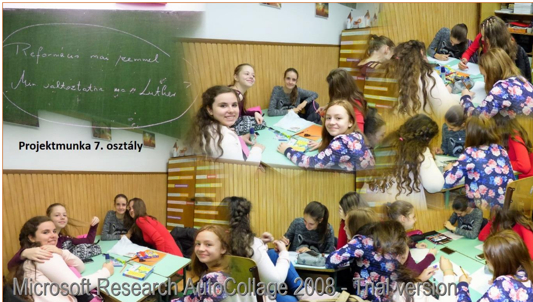
Projekt munka 7. osztály

Microsoft Research AutoCollage 2008 - Trial version